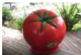
『やさいインスタ映え科』