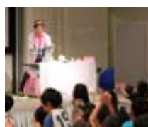
『やさいサイエンス学科』