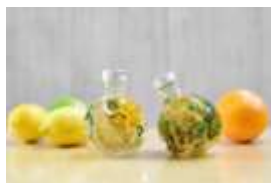
『やさいデザイン学科』

・内容：流行に敏感な大人の女性層向けに、国産野菜をふんだんに使ったヘルシーなスムージーが味わえる『やさいビューティー学科』や、野菜のハーバリウムの手作り体験ができる、女性向けの『やさいデザイン学科』、新鮮な国産野菜が購入できる『やさいマルシェ学科』などを予定しています。