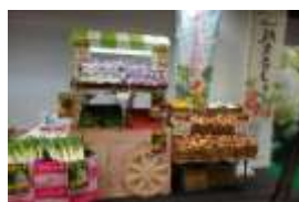
『やさいマルシェ学科』