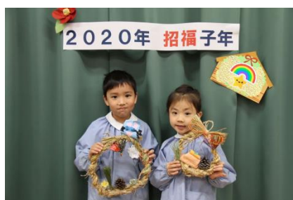
(大阪府)保育園でのしめ縄リースづくり