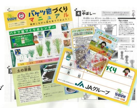
バケツ稲づくりセット内容

「バケツ稲づくりセット」のお申込み方法などは、JAグループみんなのよい食プロジェクトHP「お米づくりに挑戦」Webサイト（「バケツ稲」で検索）でご覧いただけます。また、同サイトでは、バケツ稲を自由研究に活用できるヒント集や栽培マニュアル、(先生用)指導書、食育授業などで活用できる「バケツ稲こども新聞」などを掲載しているほか、バケツ稲づくりを通じて教育機関の授業、行事で活用した事例(指導計画書、報告書、実践例)を紹介しています。また、「バケツ稲づくり栽培日記」では教育機関、公共施設などからの投稿を掲載し、稲の成長過程を時系列にご覧いただけます。