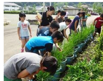
(群馬県)小学校での栽培の様子